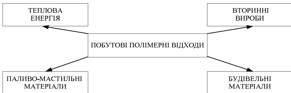
Рис. 1. Напрямки переробки побутових полімерних відходів

Отже, при переробці полімерних побутових відходів, які можуть бути реалізовані в Україні у промислових масштабах, можна виділити 4 основні напрямки отримання товарних продуктів, що наведені на рис. 1.