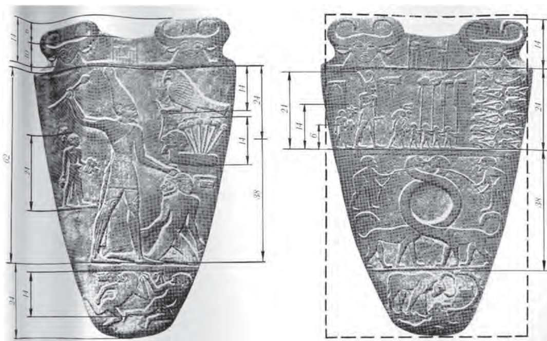
Рис. 2. Золоті пропорції в лінійній побудові зображення на плиті фараона Нармера (3 тис. до н. е.) (за Ф. Ковальовим)

З іншого боку є широкі області художньої творчості, в межах яких мистецьке вирішення відбувається суто інтуїтивно. О. Роден зауважував, що кожний шедевр несе в собі щось таємниче, що в ньому є завжди щось таке, що заставляє відчувати легке запаморочення. Ф. В. Мігдал пише: “В природі людини закладено стремління до таємничого і незвичного так само, як і стремління до практичного” (Мигдал, 1979, с. 5).