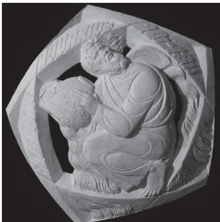
Рис. 4. "Водолій", фрагмент композиції "Дотик до зірок". Скульп. Василь Гоголь, 2017 р.