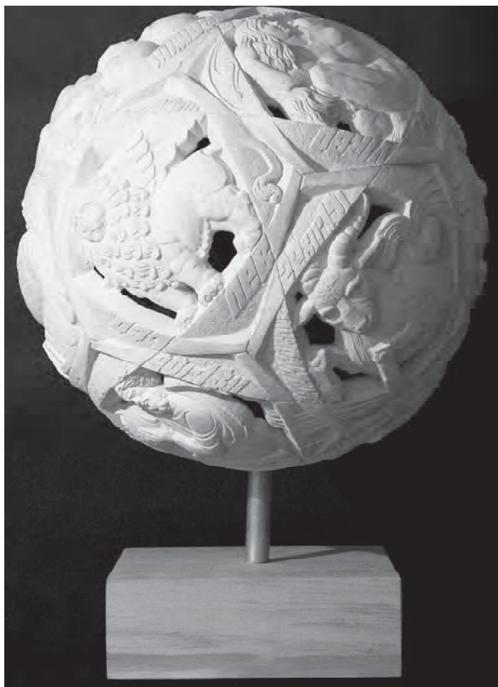
Рис. 3. "Дотик до зірок". Скульп. Василь Гоголь, 2017 р.