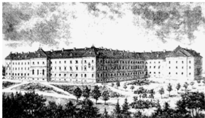
Рис. 2. Хирів. Колегія єзуїтів. Бічне крило конвікту з каплицею. Рисунок поч. XX ст.

Хирівський заклад мав власні водопровід з джерельною водою (розширений у 1913 р.), млин, пекарню, парову пральню, слюсарню і столярню. Від 1923 р. конвікт отримав для власних потреб електростанцію, господарські будинки, окремо розташований двоповерховий шпиталь для інфекційних хворих (так звана інфірмерія), два будинки для помешкань світських професорів, власну друкарню [8].