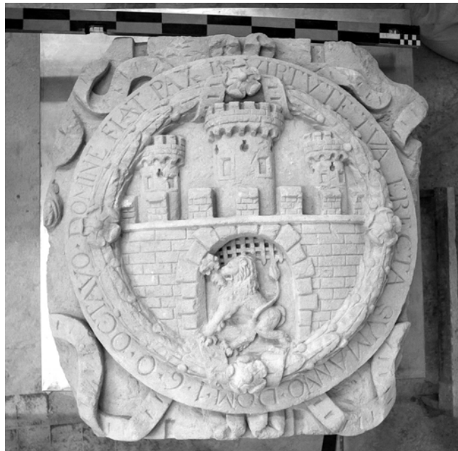
Рис. 1. Герб Львова поч. XVII ст.

Вигляд Єзуїтської хвіртки зазнавав змін. На кресленнях Дж. Бріано та на панорамі Львова поч. XVIII ст. бачимо первісний вигляд хвіртки [23, 28]. Вона була влаштована в мурі і завершувалася восьмигранною вежею з барабаном. На кожній грані вежі було вікно прямокутної форми. Вхід, пробитий у мурі, мав прямокутну форму. Припускається, що досліджуваний герб був розміщений над входом. Після перебудови хвіртка мала вже інший вигляд, це бачимо на кресленнях Ф. Пернера 1762 р. (див. рис. 2).