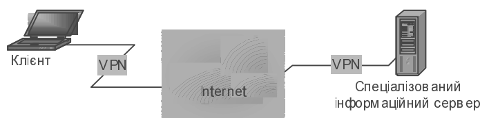
Рис. 3. Структура запропонованої комп'ютерної системи

Структурна схема системи показана на рис. 3.