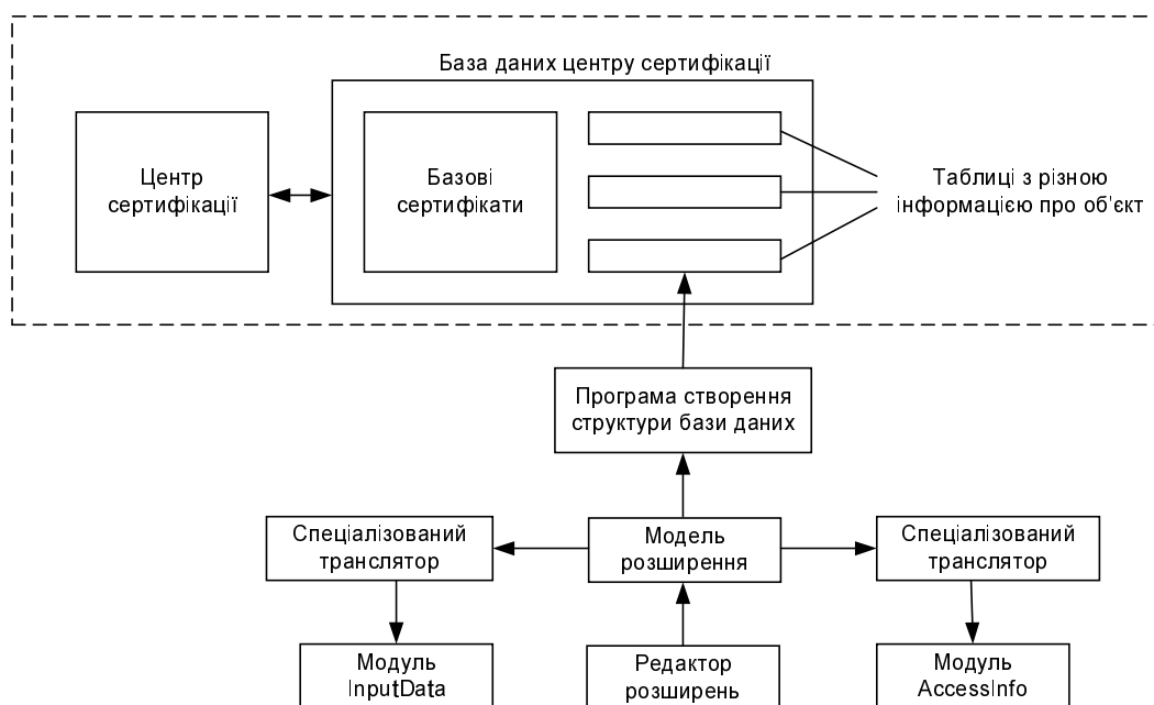
Рис. 4. Спеціалізований інформаційний сервер

Розглянемо детальніше структуру та організацію роботи спеціалізованого інформаційного сервера. Логічна структура сервера показана на рис. 4.