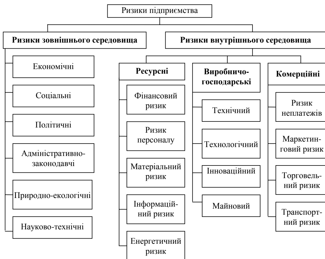
Рис. 2. Класифікація ризиків підприємства за сферою виникнення

В економічній літературі існує велике різноманіття класифікацій ризиків залежно від класифікаційних потреб, та оскільки усі ризики тісно пов'язані із середовищем функціонування організації, то їх доцільно поділяти на ризики зовнішнього та внутрішнього середовища. Найкомплекснішу класифікацію ризиків за сферою виникнення запропоновано Н.Подольчаком [22] та зображено на рис. 2. До ризиків зовнішнього середовища автор зараховує економічні, соціальні, політичні, адміністративно-законодавчі, природно-екологічні та науково-технічні. Ризики внутрішнього середовища поділяються на три великі групи, а саме ресурсні, виробничо-господарські, комерційні.