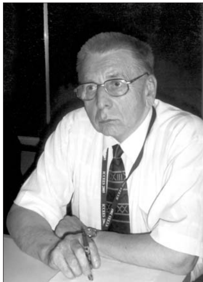
Олег Романів. Липень 2005 р.

Олег Романів — один із провідних українських учених механіків-матеріялознавців, відомий в Україні та за рубежом дослідник технічної міцності конструкційних матеріалів. Він зробив вагомий внесок у розвиток науки про фізико-механічні властивості матеріалів, зокрема у розвиток механіки руйнування.