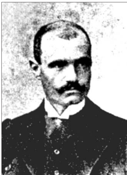
Михайло Петрович (1868—1943)

Михайло Петрович проводить наукові дослідження в галузі теорії функцій, диференціальних рівнянь, алгебри. В 30 років він став автором близько 40 математичних праць, одним із провідних професорів вищої школи. Така творча активність була незвичною для Сербії XIX ст. 1898 р. вченого нагородили Орденом св. Сави 4-го ступеня. Указом від 5 березня 1903 р. — Орденом св. Сави 3-го