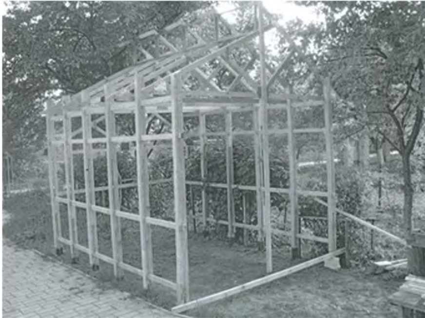
Рис. 4. Дослідна конструкція рами каркасу одноповерхового будинку

Завантаження при випробуванні проводилась вертикальними силами F і горизонтальними силами H , як показано на схемі рис. 2, б.