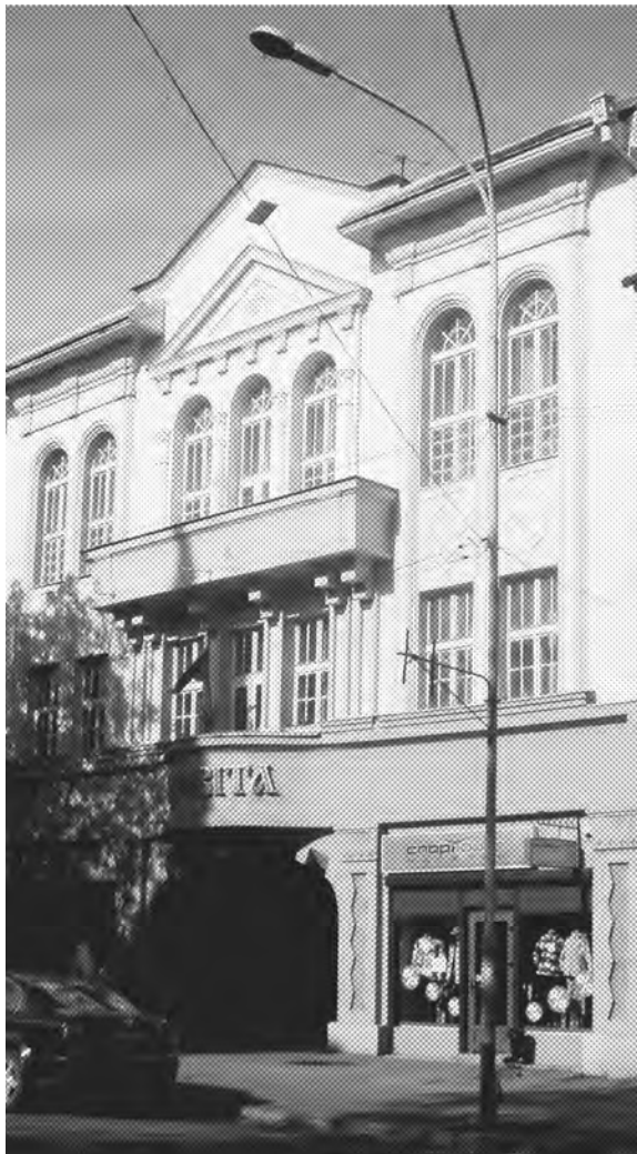
Рис. 5. Будинок “Просвіти”. Сучасний стан