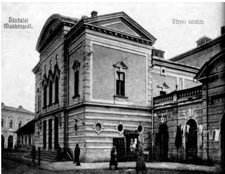
Рис. 2. Мукачівський театр, 1907 р. Сьогодні російський драматичний театр

У міжвоєнний період в театрі відбувались заходи різних національностей. В Ужгороді діяли й аматорські театральні товариства угорців (“Мозаїка”, засноване у 1920 р.), євреїв (“Габіма”), чехів і словаків. Протягом одного тільки 1933 р. на сцені театру поставлено 203 вистави; з них 97 – угорською мовою, 40 – єврейською (їдиш), 39 – чеською і словацькою, 23 українською і 4 – ромською. Тобто майже від часу заснування та будівництва театру він працював як універсальний театральний простір та виконував функції мультикультурної видовищної будівлі. Іншим цікавим прикладом є будівля, в якій сьогодні функціонує Мукачівський обласний російський драматичний театр у м. Мукачево (рис. 2). Будівництво цієї споруди розпочалось у 1896 р. і завершилось у 1899 р. Архітектором був Адольф Войта. Реалізовувала будівництво фірма Ріхарда Реслера. Глядацький зал цього театру розрахований на 500 місць. Театр побудовано за спрощеним архітектурним зразком будапештського театру “Вігсінгаз” у стилі сецесії [8] (рис. 2, 3).