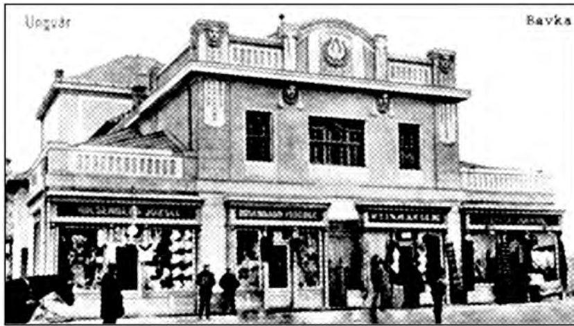
Рис. 1. Театр в Ужгороді. Листівка 20-х років ХХ ст. Нині ляльковий театр

У міжвоєнний період в театрі відбувались заходи різних національностей. В Ужгороді діяли й аматорські театральні товариства угорців (“Мозаїка”, засноване у 1920 р.), євреїв (“Габіма”), чехів і словаків. Протягом одного тільки 1933 р. на сцені театру поставлено 203 вистави; з них 97 – угорською мовою, 40 – єврейською (їдиш), 39 – чеською і словацькою, 23 українською і 4 – ромською. Тобто майже від часу заснування та будівництва театру він працював як універсальний театральний простір та виконував функції мультикультурної видовищної будівлі. Іншим цікавим прикладом є будівля, в якій сьогодні функціонує Мукачівський обласний російський драматичний театр у м. Мукачево (рис. 2). Будівництво цієї споруди розпочалось у 1896 р. і завершилось у 1899 р. Архітектором був Адольф Войта. Реалізовувала будівництво фірма Ріхарда Реслера. Глядацький зал цього театру розрахований на 500 місць. Театр побудовано за спрощеним архітектурним зразком будапештського театру “Вігсінгаз” у стилі сецесії [8] (рис. 2, 3).