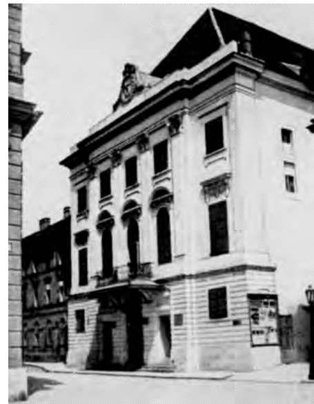
Рис. 3. Театр “Вігсінгаз”. Будапешт

Цікавим є розвиток театральної архітектури у м. Берегово, де угорське населення переважає українське. Істотний угорський вплив відчувався завжди, помітний і сьогодні. Угорці України – одна з етнічних спільнот, які міцно укорінилися на Закарпатті. Двоповерхова будівля готелю, що колись називався “Лев” (Oroszlán), розміщена на перехресті площі Героїв та Мукачівської вулиці (рис. 4). Сьогодні тут Угорський національний театр, а раніше був готель, побудований в кінці ХVІІ ст.