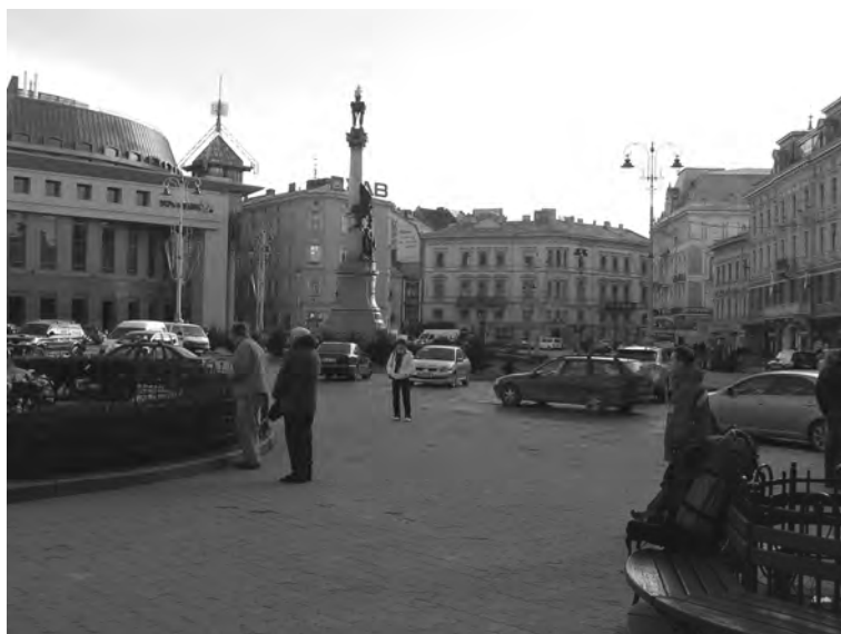
Рис. 7. Сучасний вигляд пл. Міцкевича