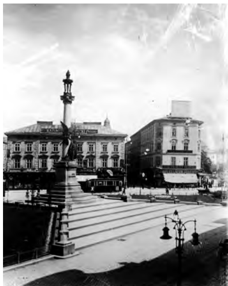
Рис. 6. Площа Міцкевича на початку XX ст.