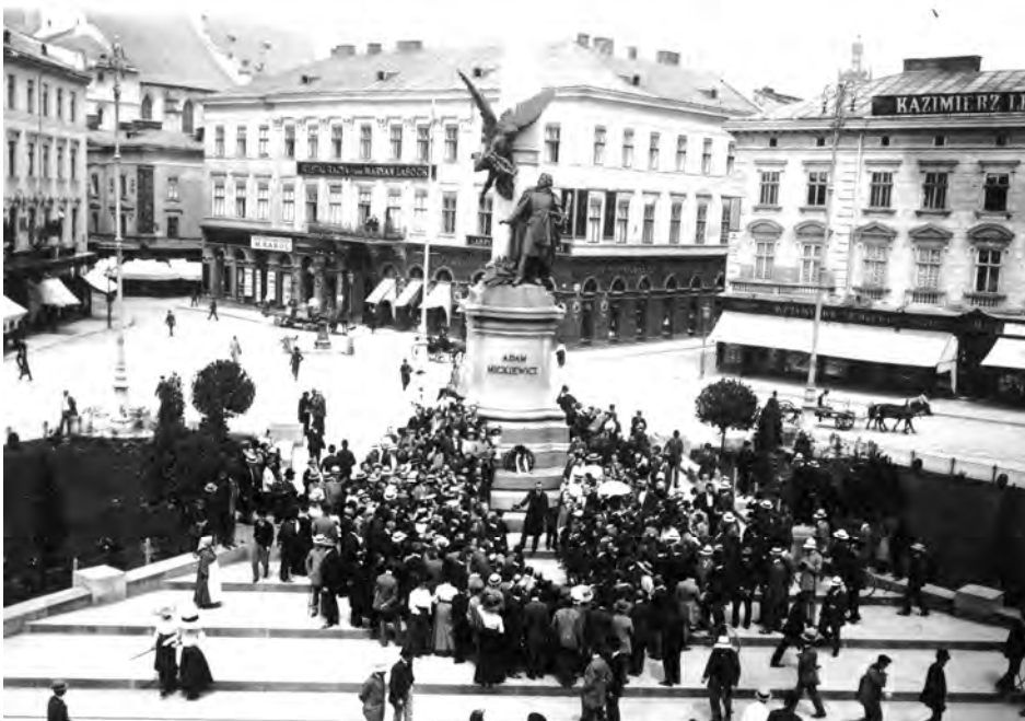
Рис. 5. Будинки № 9 та 10 на пл. Міцкевича. Фотографія першої половини XX ст.

З півдня в ансамбль площі Міцкевича композиційно входить адміністративний будинок колишнього Іпотечного банку, що збудував у 1882 р. арх. П. Покутинський. На цьому місці з 1811 р. існував готель “Під тигром”.