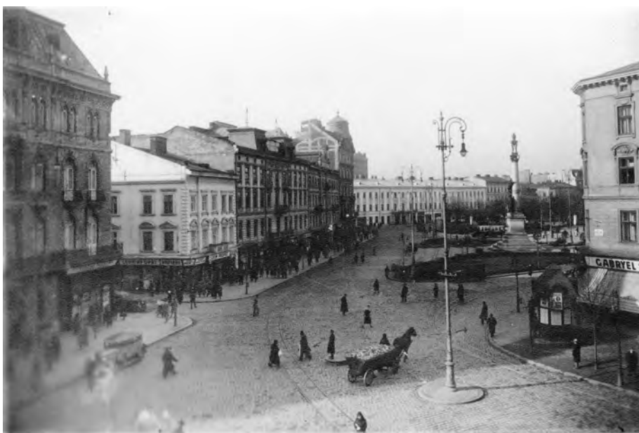
Рис. 2. Забудова площі Міцкевича. Фотографія початку XX ст.

Забудова площі Міцкевича складалась упродовж XIX і до початку XXI століть, і процес її формування ще не завершено. Архітектурний комплекс площі утворюють 11 будинків (рис. 2).