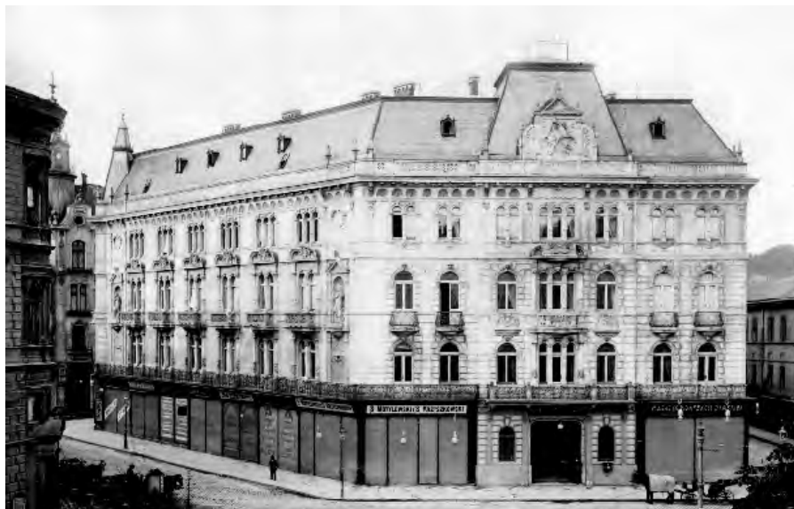
Рис. 3. Готель “Жорж” Фотографія 60-х років XX ст.

Будинок № 1/2, один з найбільших будинків на площі, – споруда готелю “Жорж”. Найстаріший з нинішніх готельних закладів України (рис 3). Працює він з 1793 р. З 1812 р. мав назву “Hotel de Russie”, з середини XIX сторіччя – “Жорж”. У 1899 р. цю будівлю було знесено, і в 1900 р. побудовано нову будівлю готелю, автори проекту якої – знамениті архітектори Г. Гельмер і Ф. Фельнер. Споруду зведено монументальну, у стилі неоренесансу, членування якого на трьох фасадах були доповнені динамічною бароковою орнаментикою та на кутах заакцентовані алегоричними статуями Європи, Азії, Америки та Африки. Ці скульптури, як і барельєф “Святий Георгій”, який розміщено в картуші на даху головного фасаду, виконав А. Попель за моделями Л. Марконі.