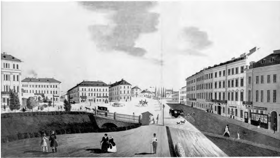
Рис. 1. Плац Фердинанда з акварелі А. Гаттона, 1847 р. [4]

За часів середньовіччя Полтва перед сучасною площею Міцкевича розділялась на два рукави і на невеличкому острові, який вони утворювали, з давніх часів була поставлена каплиця Божої Матері. У першій третині XIX ст. територію осушили, у 1840 р. через річку Полтву перекинули два мости. Так сформувалась площа, названа на честь Фердинанда д'Есте, австрійського намісника коронного краю Галичини та Лодомерії у 1832–1846 рр. Назву Фердинанд-пляц (площа Фердинанда) територія отримала з 29 червня 1843 року (рис. 1). У 1844 р. Полтва на цій території була остаточно забрана в мури і розвиток площі та її забудови продовжився. Площа трикутної форми сполучає проспект Шевченка з проспектом Свободи. На неї також виходять вулиці Театральна, Братів Рогатинців, Валова, М. Вороного, Коперника, а зі сходу примикає площа Галицька.