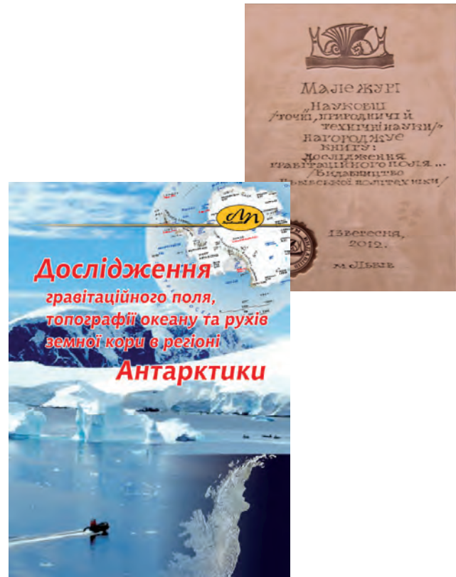
Презентація книги-переможця 19 Форуму видавців – монографії колективу авторів за редакцією О. Марченка і К. Третяка “Дослідження гравітаційного поля, топографії океану та рухів земної кори в регіоні Антарктики”