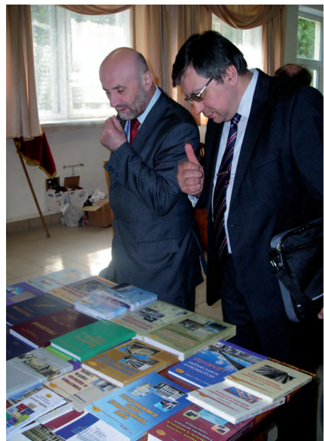
Презентація книг Інституту геодезії під час роботи ГЕОФОРУМУ–2012