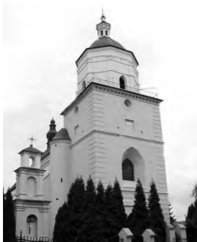
Рис. 3. Костел Св. Івана Хрестителя в Самборі

Недалеко від площі Ринок, на вул. Адама Міцкевича зберігся оборонний монастир Бернардинців з костелом Св. Станіслава. В будівлі монастиря зараз знаходиться самбірське училище культури, в костелі – зал органної та камерної музики. Тут чудесна акустика, а сам орган, реставрований естонськими майстрами у 1987 році, є одним з найкращих в Україні.