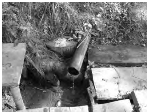
Рис. 9. Святе джерело біля церкви Стрітення в с. Велика Білина

отправлялі. Строитель монастыря Отець Макарій був на Соборе в Уневе в. р. 1711. Монастирь той знесено в. р. 1789, а фундацію продано в. р. 1801 Маврикію Іосифови Ценському за 25 000 зр.” [7, с. 148].