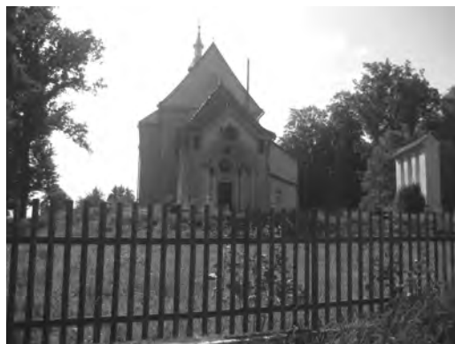
Рис. 7. Костел Святої Катерини у Воютичах

Дерев'яні церкви збереглися і діють в селах: Кружики – церква Покрови Пресвятої Богородиці (1850); Погірці – церква Воздвиження Чесного Хреста (1750); Сприня – церква Св. Миколи Чудотворця (1750) (рис. 6); Сусолів – церква Введення в Храм Пресвятої Богородиці (1780); Чайковичі – церква Івана Хрестителя (1881) та ін.