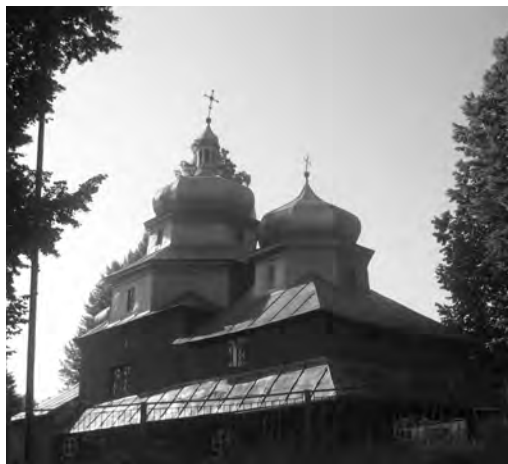
Рис. 6 . Церква Святого Миколи Чудотворця у Сприні

Духа з дзвіницею, збудована в 1671 році на місці старої, в с. Викоти. Святиня споруджена без жодного цвяха. На церкві є табличка з написом: “600-річчя церкви Зіслання Святого Духа, 1408–2008”; церква Воздвиження Чесного Хреста, збудована в 1734 р. в с. Воцанці; церква Різдва Пресвятої Богородиці в селі Зарайське, споруджена в 1634 році, а, за переказами, її перевезли зі с. Кобло Старосамбірського району. Ця церква пам'ятає всіляке лихо: напади турків, татар, москалів – ще з часів Першої світової війни. Дзвіницю