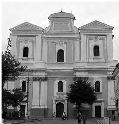
Рис. 2. Костел Святого Станіслава Бернардинського монастиря

До пам'яток архітектури загальнодержавного значення, що знаходяться в Самборі належить Ратуша (1638–1668 рр., 1844 р.) (рис. 1); Бернардинський монастир (1709–1751) (рис. 2); Костел Святого Станіслава бернардинського монастиря (1751) та дзвіниця (1751); монастирські келії (1751); Єзуїтська колегія (1749); костел Св. Івана Хрестителя (1565–1574 рр., 1642 р.) (рис. 3) [1, с. 11].