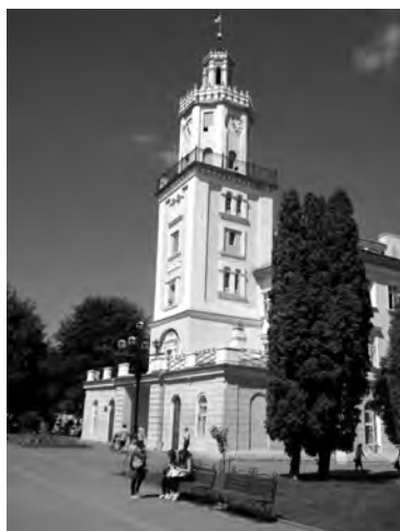
Рис. 1. Самбірська ратуша

поза межі правильного чотирикутника в східному і західному напрямках. Цей будинок мав монаші келії, кімнати для людей, які мешкали при монастирі... Спочатку монастир був оточений валом з дерев'яним частоколом. На певній відстані одна від одної знаходились дерев'яні вежі. Брама була зі сходу. На заході монастир межував з публічною дорогою та королівським млином. На півночі знаходився міський вал. Монастир був внесений в оборонну систему міста і становив одноосібний пункт оборони. Всі будівлі монастиря в 1498 році були спалені татарами. Тому в 1514 році бернардини приступили до будови нового монастиря й костелу на взірць оборонної твердині з міцними мурованими стінами” [9, с. 40].