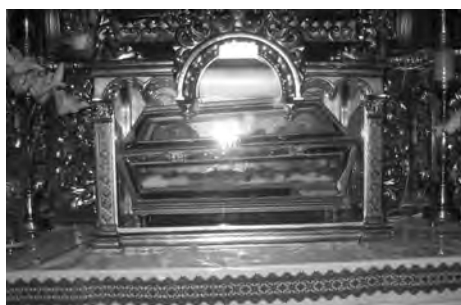
Рис. 5. Мощі Святого Валентина