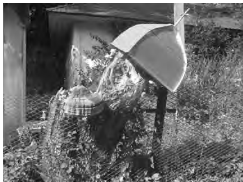
Рис. 8. Місце Богоявлення Божої Матері в с. Лука

Про монастир в селі Лука згадують дослідники М. Косак, М. Ваврик Зокрема, М. Косак, в шематизмі Провінції Св. Спасителя в розділі Монастирі в архієпархії Львовської 1867 року, зазначає дві дати: 1617 р. – ? 1711 – ? які мають відношення до монастиря та подає відповідний опис: “п. 5 Лука, св. Троїцький властиво “Монастир”, коло села Луки в. обв. Колом. Десь по р. 1600 купив Лавро Хурчковичь, подданий Потоцьких два ґрунта і заложив на них монастирь. Вь р. 1617 подтвердили Стефань Потоцький и его жена Марія Могилянка, донька Шеремія, господара молдавського фундацію Хурчковича, додаючи при том монастиреві зь своєї сторони ґрунт над самим Днестром, коло “броду Иссаковского”, аби монахи моленія за фундаторовь щодень